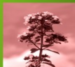
Marjolaine à coquille